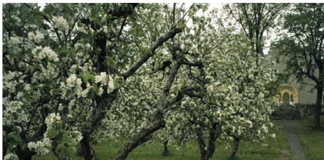
Omenankukkia Suitian kartanon puutarhassa.

Suomessa luettiin 1900-luvun vaihteeseen mennessä ulkomaisista erityisesti skandinaavisia ja saksalaisia puutarhalehtiä sekä ammattikirjoja, joita hyödynnettiin myös alan tuolloin laajemmassa mitassa käynnistyneessä kotimaisessa koulutuksessa. Lisäksi ammattiväki matkusti kansainvälisiin puutarhanäyttelyihin ja teki opintomatkoja varsinkin Pietariin, Tukholmaan,