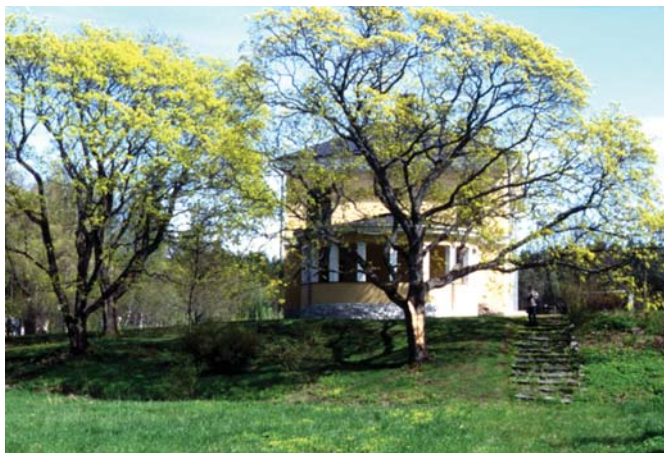
Kotimaisista jaloista lehtipuistamme pihossa, puistoissa ja puutarhoissa näkee yleisimmin metsävaahteroita. Kuvassa kukkiva metsävaahtera Brinkhallin kartanon puistossa.

Hyödyn aikakauden innostus puutarhakasvien kasvattamiseen hiipui vähitel-