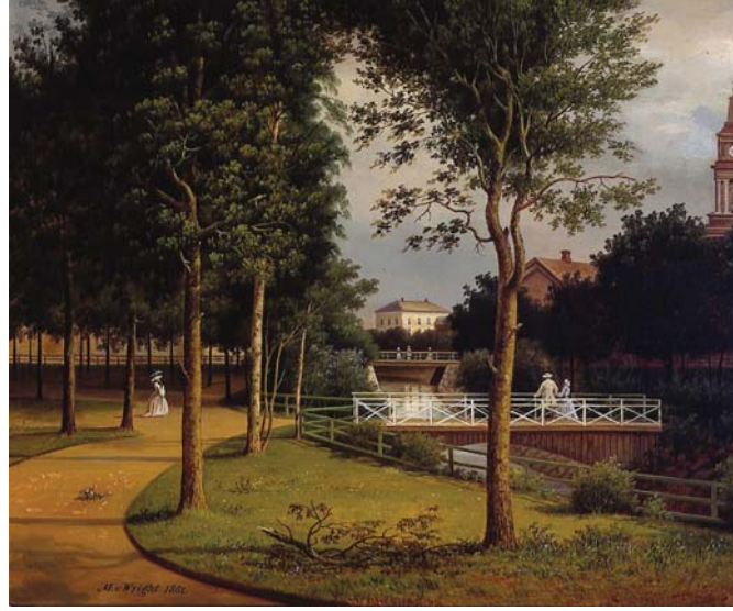
Magnus von Wrightin maalaus esittää Oulun Kaupunginojan puistomaisemaa 1860-luvulla. Oikealla näkyy Tuomiokirkon torni. Teos: Oulun taidemuseon kokoelmat.

Esimerkiksi Turussa otettiin vuoden 1827 palon jälkeen tavoitteeksi rakentaa kaupunkiin väljä kaupunki- ja korttelirakenne, jossa leveät kadut, puu-