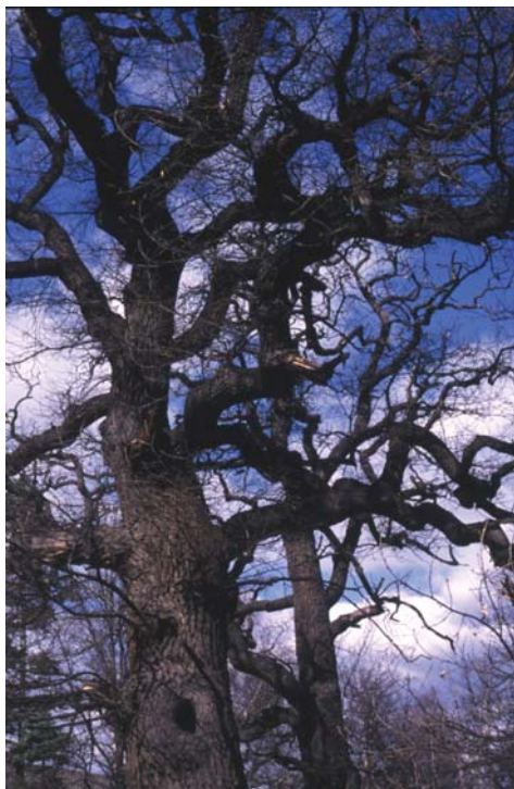
Vanhat mutkaokaiset tammet ovat näyttäviä puita myös talvisaikaan.

Eräiden havupuiden, kuten siperianpihdan ja siperiansembran suosio puistopuuna lisääntyi. Ne ovat yhä lei-