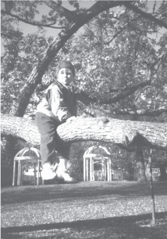
Puistoissa löytää leikkipaikan mistä vain. Kuva Auroran puistosta Espoosta.

Puistot määritellään monesti hoidetuiksi ja osittain istutetuiksi alueiksi. Puistikot voidaan määritellä puolestaan hoitamattomiksi ja rakentamattomiksi alueiksi. Usein ne ovat hoidettujen alueiden reunoille jääviä jännittäviä alueita. Juuri nämä alueet ovat lasten erityissuosiossa niiden haasteellisuuden ja mielikuvitusta ruokkivan hoitamattomuuden takia. Koska aluetta ei ole rakennettu, jää lapsille tilaa toteuttaa omia ideoitaan vaikkapa majan rakentamiseksi. Majan rakentaminen on aina viehättänyt lapsia ja puistikoista löytyykin irrallisia keppejä ja muuta rakennusainetta tähän tarkoitukseen. Tässä puuhassa tärkeintä on itse rakentaminen sekä sen mukanaan tuoma toiminnan ja luomisen ilo.