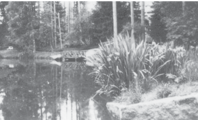
Olavi Paavolaisen maisemia Kivennavalla.

Joel Lehtosen novelli Kuolleet omenapuut kuvittaa loistavasti kahta suomalaista perusasennetta puutarhaan, kielteistä ja myönteistä. Erään kokoelmansa nimessä Korpi ja puutarha hän asettaa ikään kuin vastakkain nämä kaksi luonnon-elementtiä. Aapeli Muttisen hahmossa itsensä kuvannut Lehtonen on kuin roomalainen runoilija Horatius maahuvilallaan ja sen puutarhassa. Muttisen Putkinotkon rehevää rappiota voi vieläkin ihaila Säämingin Inhassa, eräässä kansallismaisemassamme.