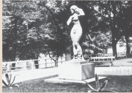
Wäinö Aaltosen Turun lilja vuodelta 1928.

Myös moni suurmies on saanut muistomerkkinsä keskeisiin puistoihin. Suomen ensimmäinen suurmiesmuistomerkki paljastettiin Turussa vuonna 1864, kun historian professori Henrik Gabriel Porthan sai mietiskelypaikkansa tuomiokirkon viereisestä puistikosta. Kansallisrunoilija J. L. Runeberg on puolestaan vuodesta 1885 lähtien tarkkaillut patsaana Helsingin Esplanadipuiston kulkijoita.