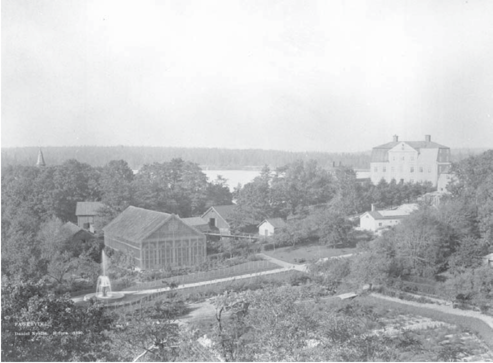
Fagervikin kartano Inkoossa vuonna 1890.

kansallisen historian ja kansanrunouden tutkimuksemme suunnan näyttäjä H. G. Porthan.