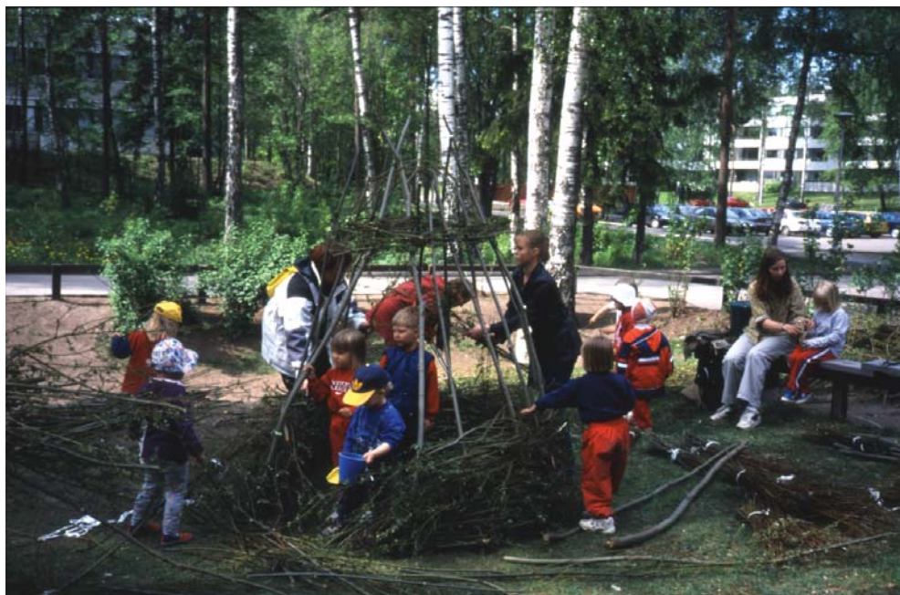
Pajumajan rakennusta leikkipuistojuhlilla Espoossa Vihervuonna 2000.

ne rakennelmineen. Puistoihin liittyy paljon muistoja ja historiaa. Ne ovat käytössä eläviä historiankirjoja.