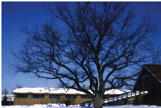
Tammi Hämeen ammattikorkeakoulun puistossa Hattulan Lepaalla. Iso, vanha tammi tarvitsee paljon tilaa ympärilleen kehittyäkseen ko-meaksi puuksi.

Silander, V.; J. Lehtonen; T. Nikkanen. (2000). Ulkomaisten havupuulajien menestyminen Etelä-Suomessa . Metsäntutkimuslaitoksen tiedonantoja 787.