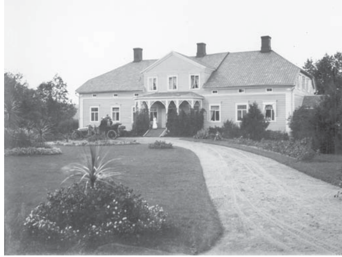
Seestan kartanon puutarhaa. 1910–1920-luvuilta.

ten kasvilajikkeiden menestyminen maamme ilmanalassa vaatii erityishuol- ta. Pyrkimys kesyttää luonnon voimia ja jalostaa niitä vaikuttaa vuorostaan myös ihmiseen. Topelius oli metsien ja puutarhojen puolestapuhujana, Societas Pro Fauna et Flora Fennican kantavana jäsenenä ja omien kotipuutarhojen- sa viljelijänä samanlainen käytännön mies kuin esim. Lönnrot.