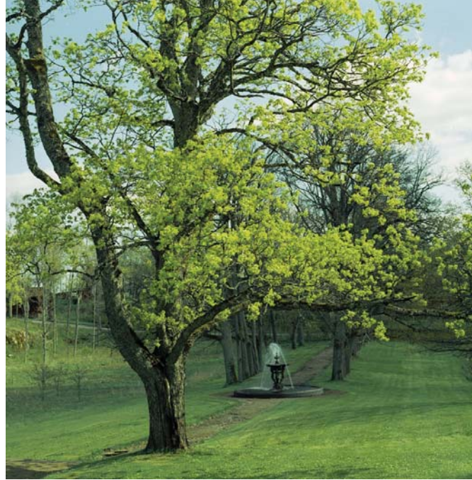
Vaahtera ja suihkulähde Fagervikin kartanon puistossa.

Samalla puutarhoissa käytetty kasvivalikoima moninkertaistui ja viljely-, rakennus- sekä hoitotekniikat kehittyivät. 1900-luvun alkuun mennessä puutarhasuunnittelu perustui yhä mittavampaan maiseman muokkaukseen – maansiirtoihin, leikkonurmikoihin, vesisaiheisiin. Tosin kasvavat työvoimakus-