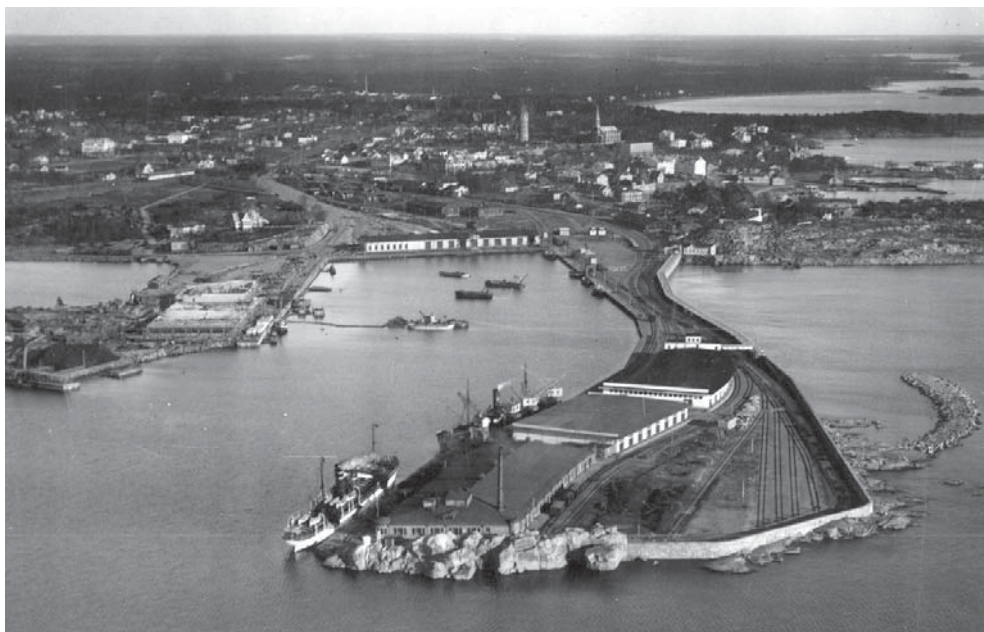
Hangon satama 1920-luvulla. Kaupunki rakennettiin aivan sataman kylkeen. Etualalla näkyy Korkeasaaren laituri, jonka päähän kaupunki rakensi komean voimakasiinin 1900-luvun alussa. Makasiinin viereisellä laiturilla on Suomen Höyrylaiva Osakeyhtiön laiva.

Ennen lähtöä kokoonnuttiin siirtolaishotellin alakerran saliin. Kaksi hotellin alakerran huonetta oli varattu vahtimestarin asunnoksi ja aamuisin vah-