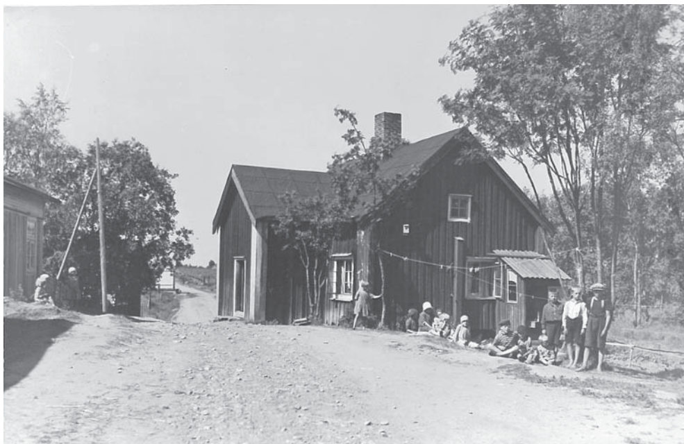
Kristiinankaupungin tullituvat Närpiöön johtavan maantien varrella. Kuva on otettu vuonna 1928, jolloin läntinen tullitupa vielä oli pohjoisen tuvan vieressä paikalla, jossa tulliaita 1800-luvulla sijaitsi.

holmassa tehtyjen mallien mukaan, joista ensimmäiset annettiin vuonna 1730. Vuonna 1759 julkaistiin uudet piirustukset. Jälkimmäinen malli toteutui ainakin Kajaanissa, Raumalla, Loviisassa, Oulussa, Uudessakaarlepyyssä ja Kristiinankaupungissa. Sotilastorpan kokoisissa mökeissä oli yksi tupa ja kaksi kamaria. Vaatimattomat tullituvat ovat jääneet kaupungeissamme muutosten alle ensimmäisinä eikä niiden historiallista merkitystä ole juuri harkittu.