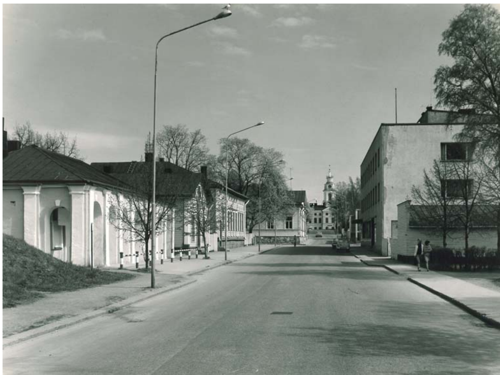
Haminan Lappeenrannan portin vuonna 1774 valmistunut vartiorakennus on kuvan etualalla raatihuoneelle johtavan katulinjan alkupäässä, bastionimuurin kupeessa. Katulinjan päätepisteenä on raatihuone.