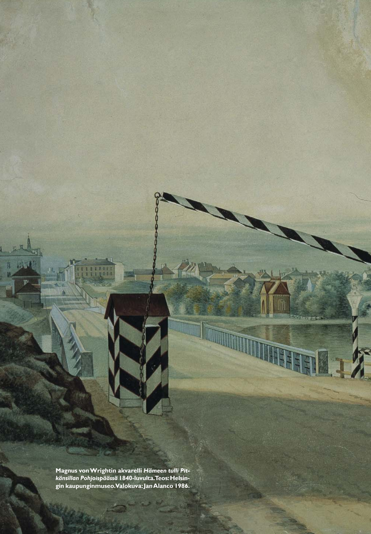
Magnus von Wrightin akvarelli Hämeen tulli Pitkäsillan Pohjoispäässä 1840-luvulta. Teos: Helsingin kaupungin museo. Valokuva: Jan Alanco 1986.