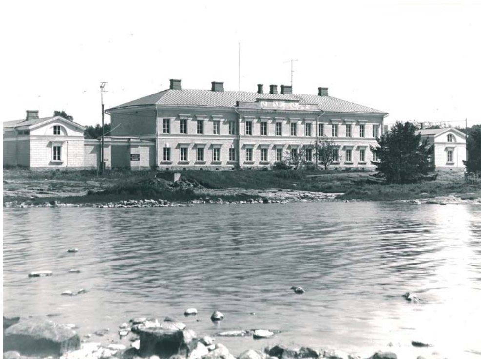
Eckerön tull- ja postitalo nähtynä lännestä. Kuva: P-O.Welin 1983, Museovirasto.