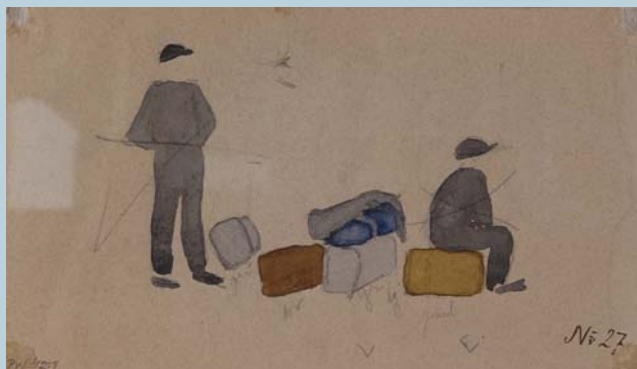
Helene Schjerfbeck maalasi 1900-luvun alussa siirtolaisaiheisen vesiväriluonnoksen Matkustajia Hyvinkään asemalla . Teos: Riihimäen taidemuseo, Tatjana ja Pentti Wähäjärven kokoelma. Kuva: Roope Kolehmäinen.

Osakeyhtiön eli Finska Ångfartygs Aktiebolagetin palveluksessa siirtolaisasiamiehe-