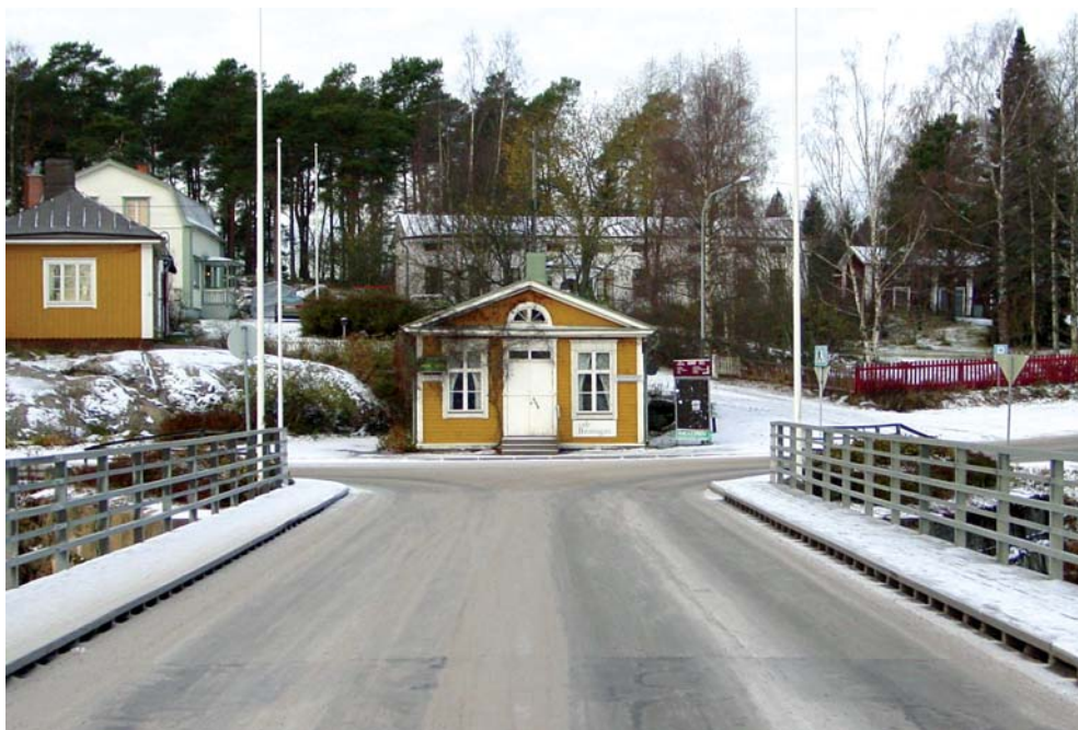
Uudenkaarlepyyn Brostugan sillan päätteenä kaupungista katsoen. Sillalta kääntyy vasemmalle vanha Vaasan tie.

tullitalot, joista eteläinen sijaitsi kirkkoaidan eteläpuolella, säästyivät suuressa kaupunkipalossa vuonna 1858.