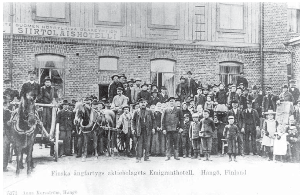
Suomen Höyrylaiva Osakeyhtiön siirtolaishotelli Bulevardilla valmistui vuonna 1902 ja se pystyi majoittamaan 300 henkeä. Samassa korttelissa sijaitsivat siirtolaiskonttori ja pankki, jossa voitiin vaihtaa Amerikan dollareita.

Siirtolaisilla oli 1880-luvulla mahdollisuus lähteä Hangosta talvisin jo neljää eri reittiä, Tukholman, Kööpenhaminan, Lyypekin tai koillisenglantilaisen Hullin satamakaupungin kautta. Tästä Suomen Höyrylaiva Osakeyhtiön Hangon–Hullin linjasta tuli varsinainen suuri siirtolaislinja. Valtio tuki yhtiötä, koska samoilla laivoilla kuljetettiin myös voita. Hullista siirtolaiset matkustivat junalla Liverpoolin tai Southamptonin lähtösatamiin. Matka