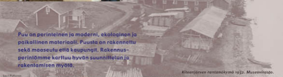
Kiteenjärven rantanäkymä 1932.

Rautakaudelta meidän päiviimme jatkuneen lamasalvosarkkitehtuurin moduulina on hirren mitta. Käsityö kehittää käytännön järkeä, pään ja käden yhteistyötä. Itähämmäläistä hirsirakentamista 2000-luvulla.