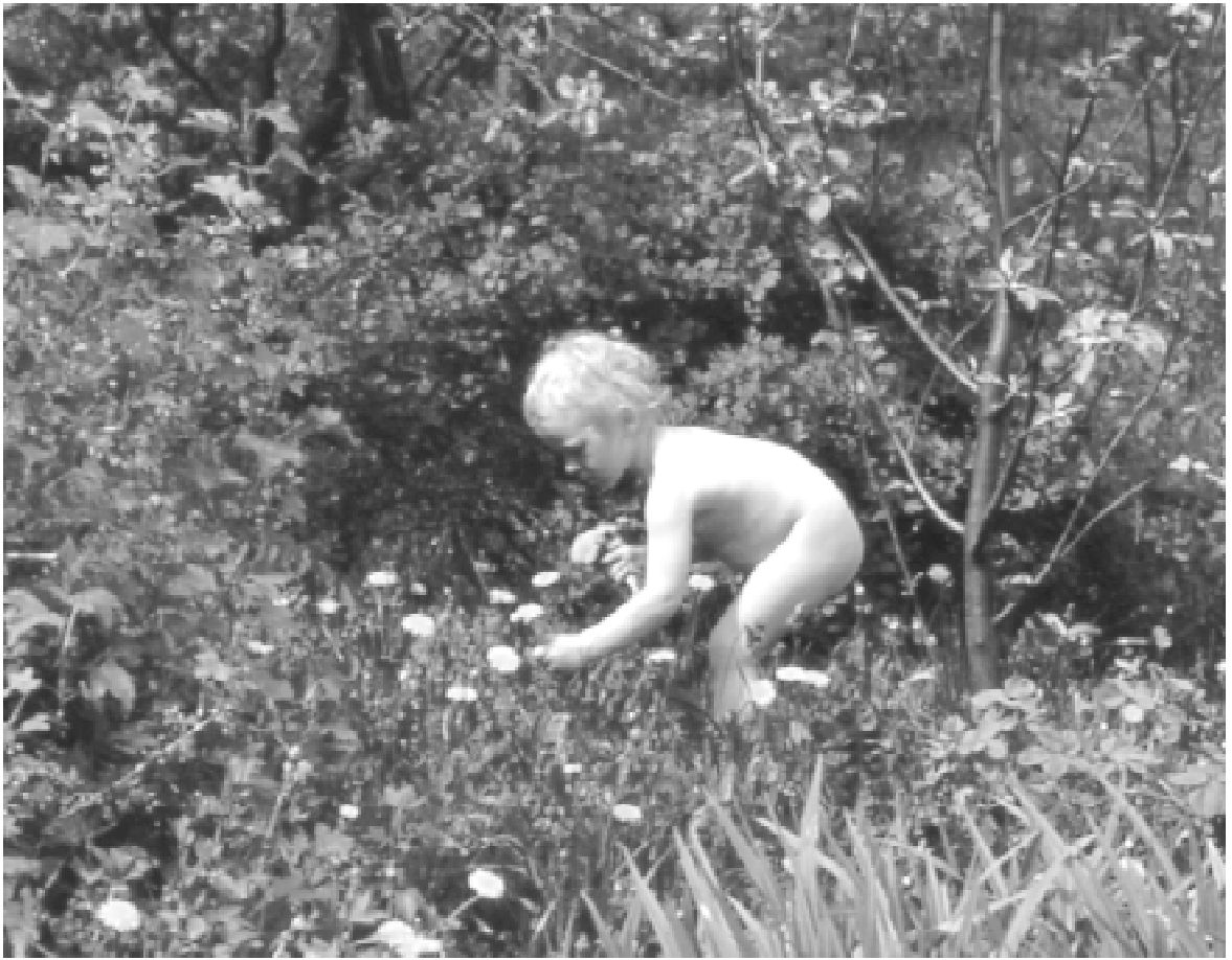
För de små barnen är möjligheterna att röra sig begränsade och därför är den egna gårdens barnvänlighet avgörande för att barnen kan vara ute.

naturen finns närmare erbjuder den orörda miljön otaliga möjligheter att röra på sig, att upptäcka nya platser, att gömma sig och att få vara lite ifred.