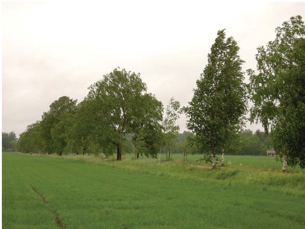
Halikon Joensuun kartanon vanhassa koivukujanteessa on eri-ikäisiä puita. Vanhat puut ovat pääosaksi hieskoivuja. Nuoremmat ovat rauduskoivuja. Vanhojen hieskoivujen latvus on leveä ja pyöreä, rauduskoivuilla on pystympi kasvutapa, varsinkin nuorempana. Eri koivulajeja käyttämällä syntyy aivan erilainen tila.

Monet vanhat kujanteet ovat uusi- misen tarpeessa. Esimerkiksi Maa- ja kotitalousnaiset sekä Tieliikelaitos ovat