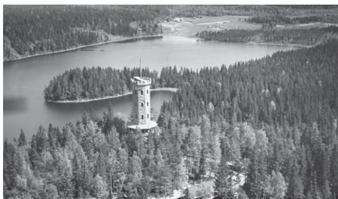
Lintuperpektiivi vakiintui yhdeksi hallitsevista näkökulmista puistoon. Aulangonvuori, graniittitorni ja Aulangonjärvi. Veljekset Karhumäen postikortti 1930-luvulta. Yksityiskokoelma.

Tarkasteltiinpa kohdetta puutarhataiteen, matkailun tai metsänhoidon näkökulmista, nousee esille maiseman