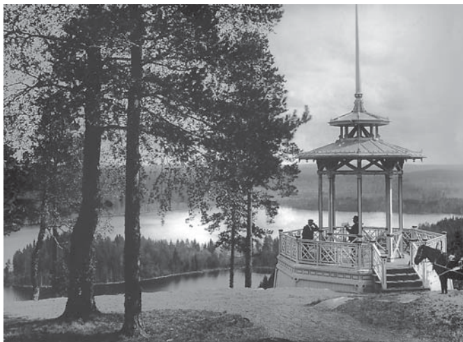
Teetarjoilua Aulangonvuoren nikkarityylisessä huvimajassa 1900-luvun alussa. Kuva: C.O. Saxelin. Postikortti. Yksityiskokoelma.

Pidämme Aulankoa kansallismaisemana. Tähän on kaksi eri syytä: kulttuurimaisema ja itse harju. Paikka on osa Vanajaveden laakson perinteikästä kulttuurimaisemaa, joka pohjoisesta Sääksmäen Rapolasta jatkuu Vanajanselän halki kaakkoon. Vesireitin varrelle sijoittuu keskiaikaisen Hämeen edustavimpia muistomerkkejä: Hattulan Pyhän Ristin kirkko, Lepaa ja muita vanhoja herraskartanoita sekä etelässä Hämeenlinna lukuisine muistomerkkei-