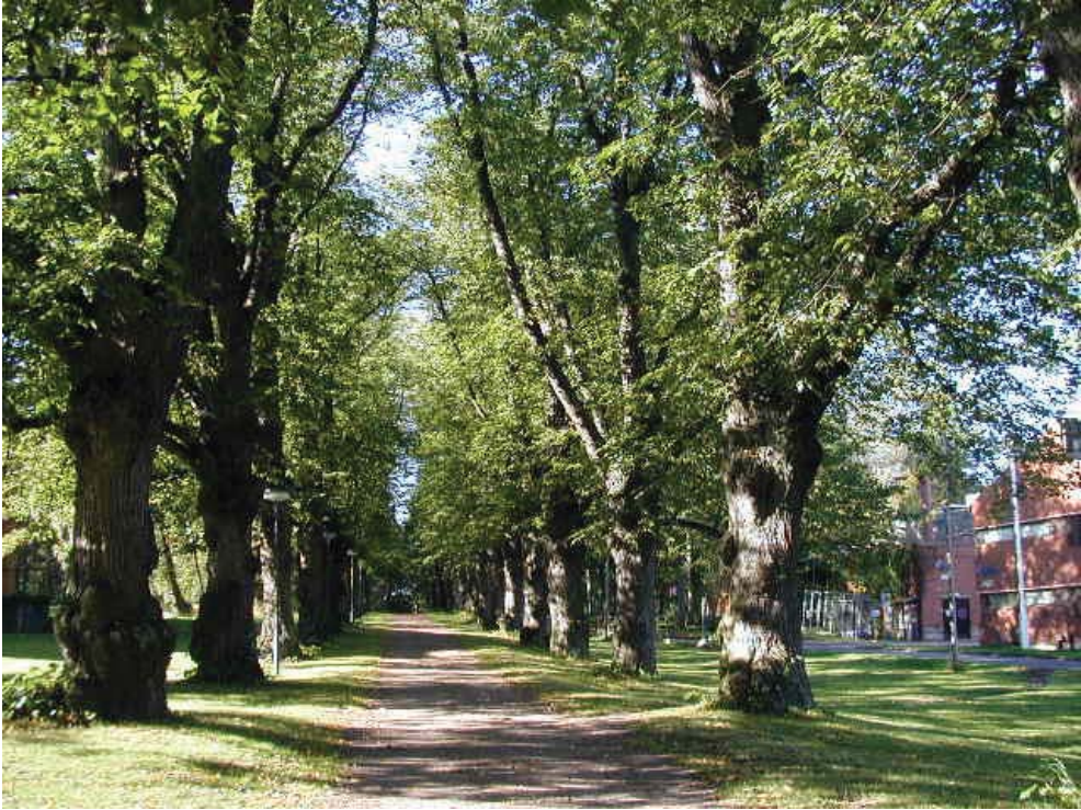
Vanha lehmuskujanne on tunnelmallinen osa uutta rakennettua ympäristöä. Kujanne on kuulunut Hagalundin kartanopuistoon, nykyään se on Otaniemen korkeakoulurakennusten keskellä kevyen liikenteen väylänä. Kuva: Camilla Rosengren.

dyttiin nykypäiviin saakka jatkuneeseen restaurointi- ja kunnostusprojektiin.