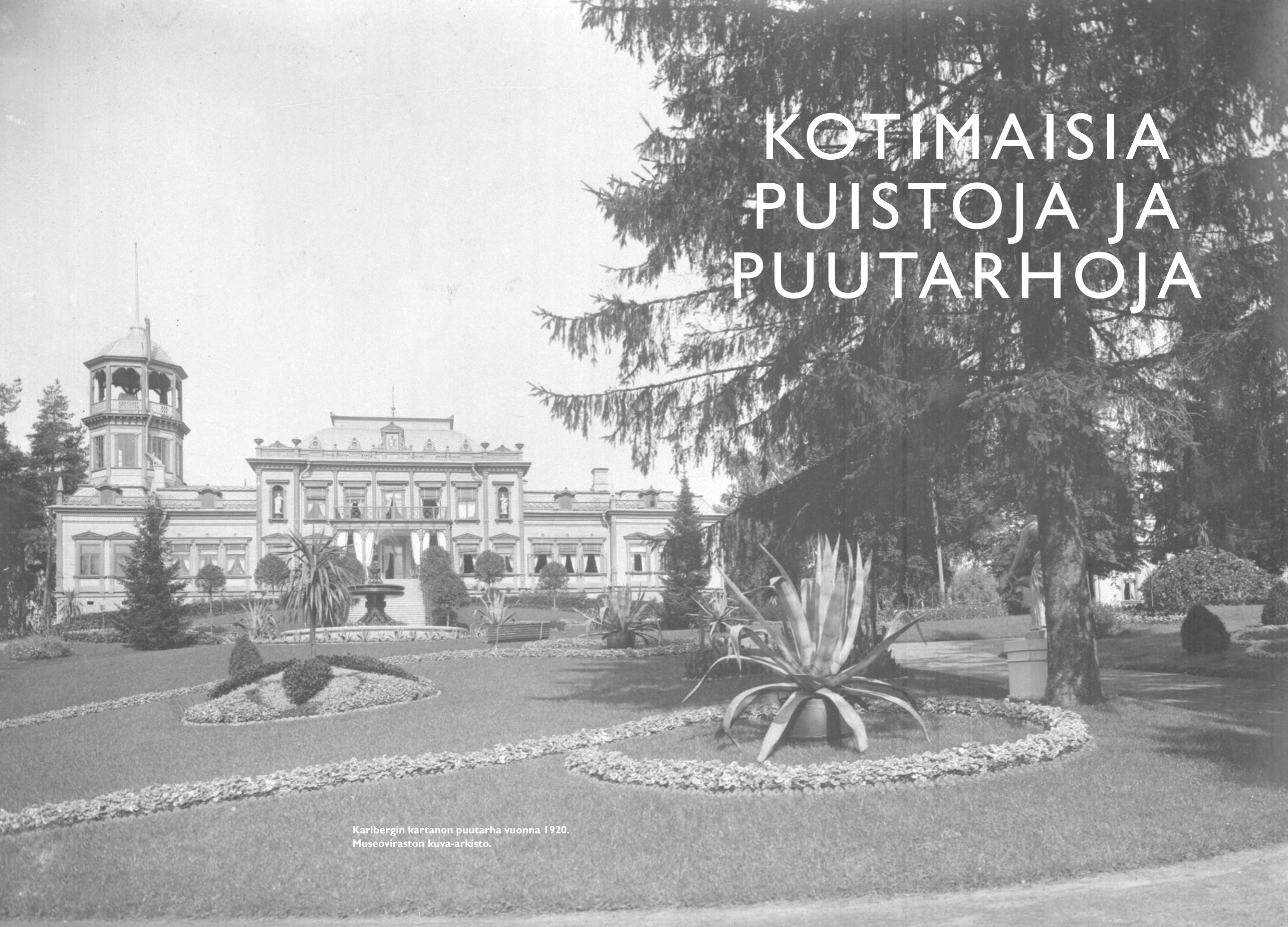
Karlbergin kartanon puutarha vuonna 1920.