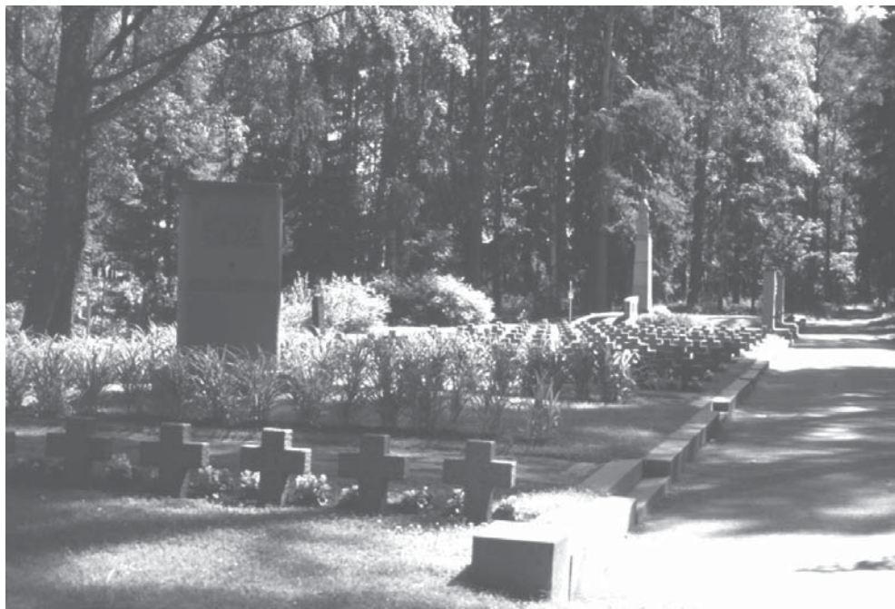
Nurmeksen sankarihaudat ovat juhlavasti korkealla harjulla vanhan kirkonpaikan ja säilyneen kellotapulin läheisyydessä.

Talvisodassa palattiin samaan käytäntöön. Ylipäällikön määräyksen mukaisesti kuljetettiin sekä vuosien 1939–1940 että 1941–1944 sodissa kaatuneet kotipaikkansa sankarihautoihin. Tästä syystä muissa maissa huomionosoituksen kohteina olevat suuret sotilashau-