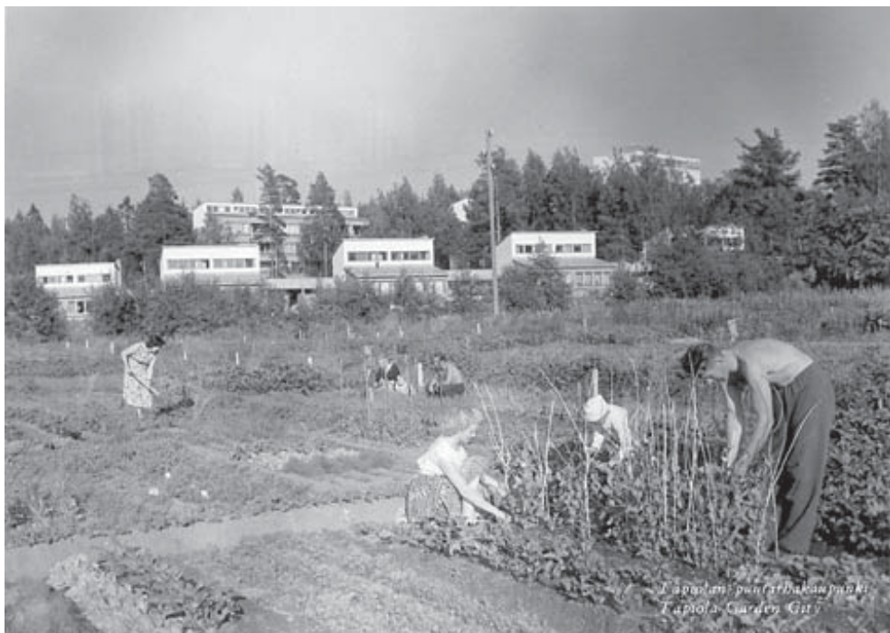
Asuntosäätiön postikortti Silkkiniitystä 1960-luvulta. Taustalla Aulis Blomstedtin suunnittelemat Asunto Oy Ketjun rivitalot vuodelta 1954.

Suuret avoimet nurmikentät ovat keskeinen osa Tapiolan kaupunkikuvaa. Silkkiniitty on toinen Tapiolan merkittävistä isoista puistoista. Se on rakennettu 1960-luvun alussa. Puiston on suunnitellut puutarha-arkkitehti Jussi Jännes ja toteutuksen on valvonut Asuntosäätiön ylipuutarhuri C.J. Gottberg. Loivasti kaartuva entinen viljelyaukea, Silkens äng, sijaitsee keskellä