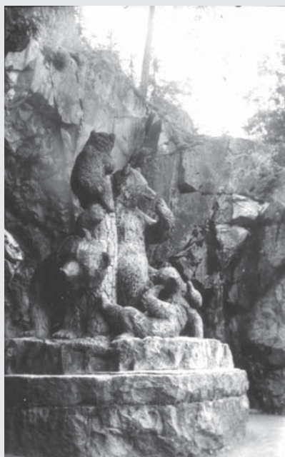
Robert Stigell, Aulangon Karhuveistos. Postikortti 1900-luvun alkupuolelta. Yksityiskokoelma.

Stigellin oman elämän viimeisiä vuosia varjosti sen sijaan avioliiton kariutuminen. Joulukuussa 1907 taiteilija kuoli keuhko-kuumeeseen ja Karhuveistos jäi hänen viimeiseksi suurteoksekseen.