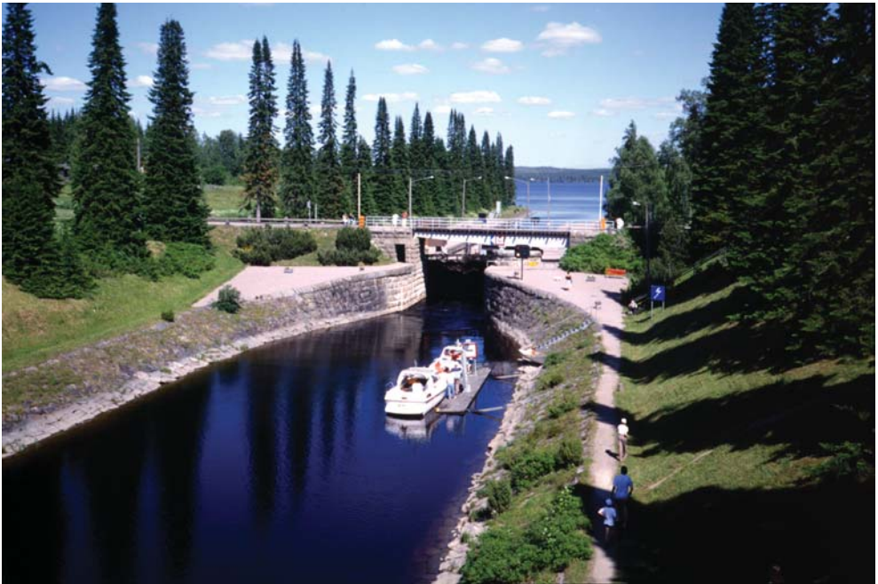
Herraskosken kanava 1990-luvulla.

Pihan ja puiston istutuksista saamme selvän kuvan puistossa säilyneistä puista sekä niiden istutuksen jälkeisestä menestymistarkastuksesta vuodelta 1892. Tuossa dokumentissa mainitaan useita pensaita: ruusut ja angervot lajiryhminä, lumimarja, happomarja ym. Niin ikään mainitaan puiston perusrungon muodostavat tammet, pihdat, lehtikuuset ja sittemmin kadonneet kanadantuijat, jotka aikanaan reunustivat havunvihreinä puistossa olevaa pientä heleänvihreiden lehtikuusten kukkulaa. Kukkulan päällä oli levähdyspaikka, josta saattoi lämpimänä kesäpäivänä