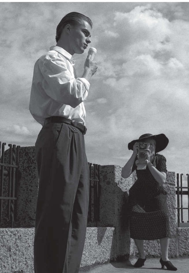
Maisemamatkajat ovat kavunneet torniin.

Sosiaalisessa mielessä tähän yhteyteen kuuluu myös yhdessäolo – perherituaalit, luokkaretket sekä nuorten ja vanhojen kohtaaminen. Edelleen valoi-