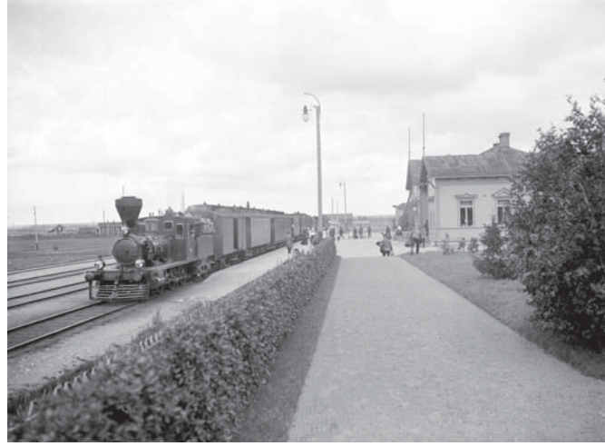
Asemapuiston pitkänomainen muoto korostuu erityisesti puiston radanpuoleisella osalla. Porin vanhalla asemalla 1900-luvun alussa oli pensasaidan lisäksi puuita. Nurmikenttien reunat olivat täsmälliset. Kuvassa näkyy myös kasvunsa alussa olevia havupuita.

Kaupunkirakenteeseen liittyviä asemapuistoja on maassamme vain muutamia. Turussa on Ratapihankadulla, asemaa vastapäätä pieni Asemapuisto, joka on vilkas läpikulkupaikka kaupungilta asemalle.