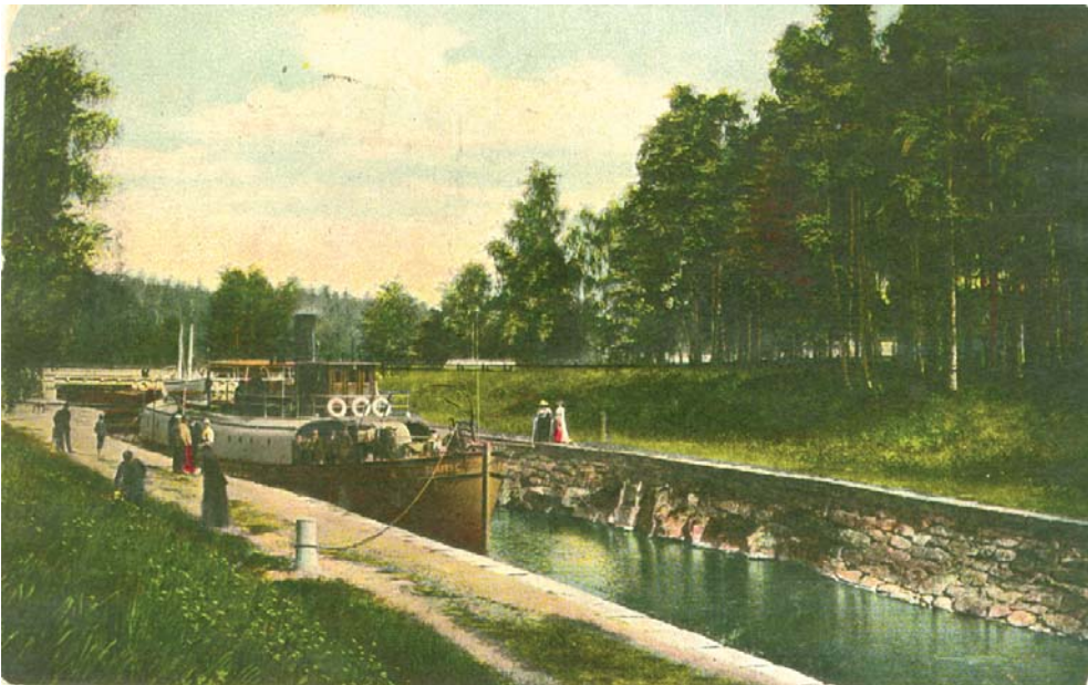
Muroleen kanava. Postikortti 1900-luvun alusta.

Rättijärven kanavapuutarhalla toimitettiin taimet ja kukat istutuksia varten. Sen puisto oli matkustajille avoin. Nuo hoidetut kukkapenkit, puu- ja pensasistutukset osana mitä kauneinta ihmisen ja luonnon yhdessä aikaansaama maisemakokonaisuutta antoivat monille syyn tallentaa valokuviiin juuri näitä näkymiä kanavalla. Käytävät, koivurivit ja kentät loivat avoimuuden,