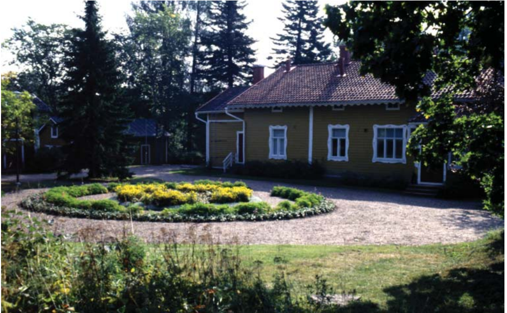
Mälkiän kasööritalon – nykyisen kanavamuseon – etupihalle on palautettu kanavien virkataloissa yleinen etupihan pieni muotopuutarha.

Itälaidalla sijaitseva kasöörin virkatalo puutarhoineen on hieman kanavan yläpuolella, alakanavan varteen istutettujen vaahteroiden takana. Rakennuksen rikasta julkisivukoristelua karsittiin 1900-luvun alkupuolella. Taloon kuului useita talousrakennuksia ja sitä ympäröi hyvin hoidettu muotopuutarha. Sen etelärinteessä oleva hyötypuutarha on ollut avoin tila. Omenapuita on vielä jäljellä, samoin joitakin mahdollisesti alkuperäisiä koristepensaita kuten korallikanukkaa, angervoja ja terttuseljaa. Viehättävä, vanhaa alkuperää oleva kaulokainen kukkii Muroleen sulun nurmikoilla vapaasti. Alakanavan itälaitaa taas reunustivat pihdat, jotka olivat yleisesti käytettyjä kanavanlaitojen ja kasööripuistojen koristepuita. Poppeliku-