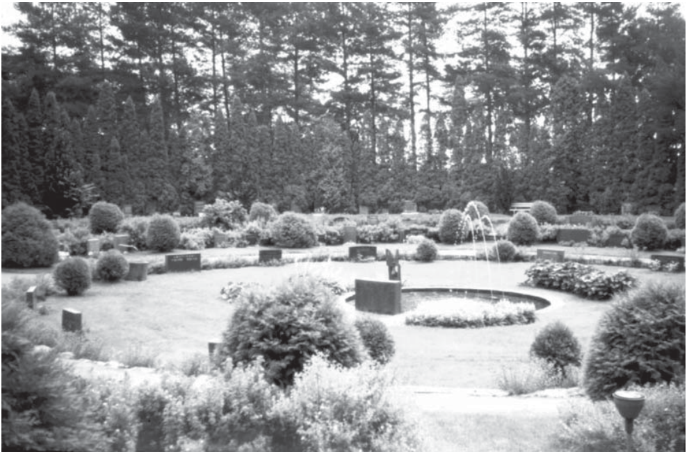
Malmin suurelta hautausmaalta Helsingissä löytää lukuisia toisistaan puulajivalikoimaltaan ja suunnittelultaan poikkeavia kokonaisuuksia.

Keski-Euroopassa monet hautausmaat ovat suosittuja suurmiesten, taiteilijoiden, säveltäjien ja kirjailijoiden haudoille suuntautuvien uuden ajan pyhiinvaellusmatkojen kohteita. Jo 1800-luvulla auttoi Pariisiin Père Lachaisen hautausmaasta tehty opaskirja esimerkiksi Abelardin ja Heloisen tai Chopinin haudan löytämisestä. Pietarissa on Aleksanteri Nevskin luostarin hautausmaan tuhansien musiikin ja kirjallisuuden rakastajien kohteena heidän jättäessään kukkatervehdyksen Tšaikovskin tai Dostojevskin haudalle. Parmassa taas nuoret viulistit kunnioittavat Paganinia soittamalla hänen haudallaan.